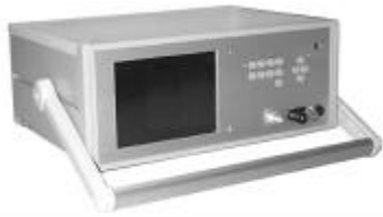
写真1 スーパークーロンメータ「PX03SC1」